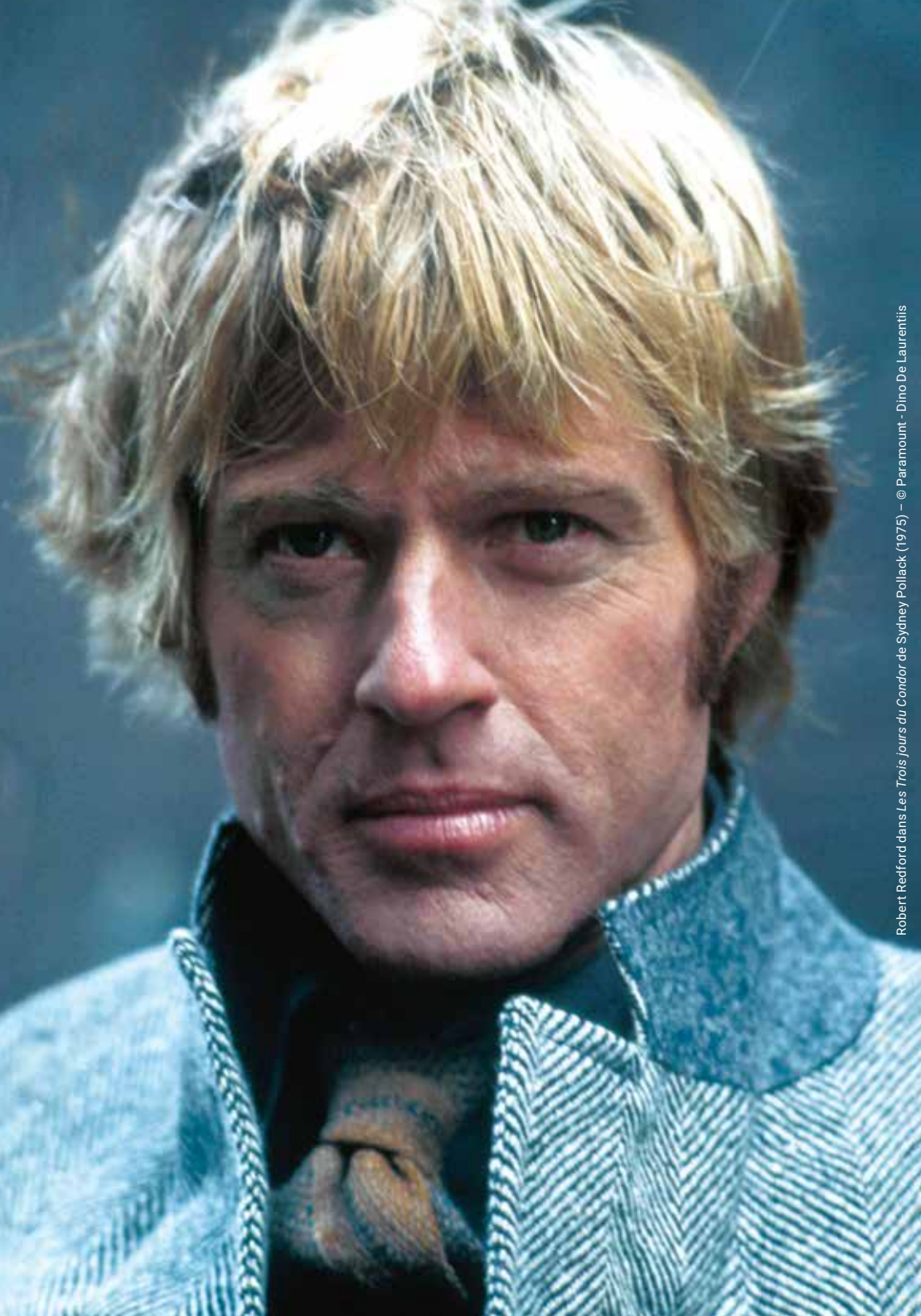
Robert Redford dans Les Trois jours du Condor de Sydney Pollack (1975)