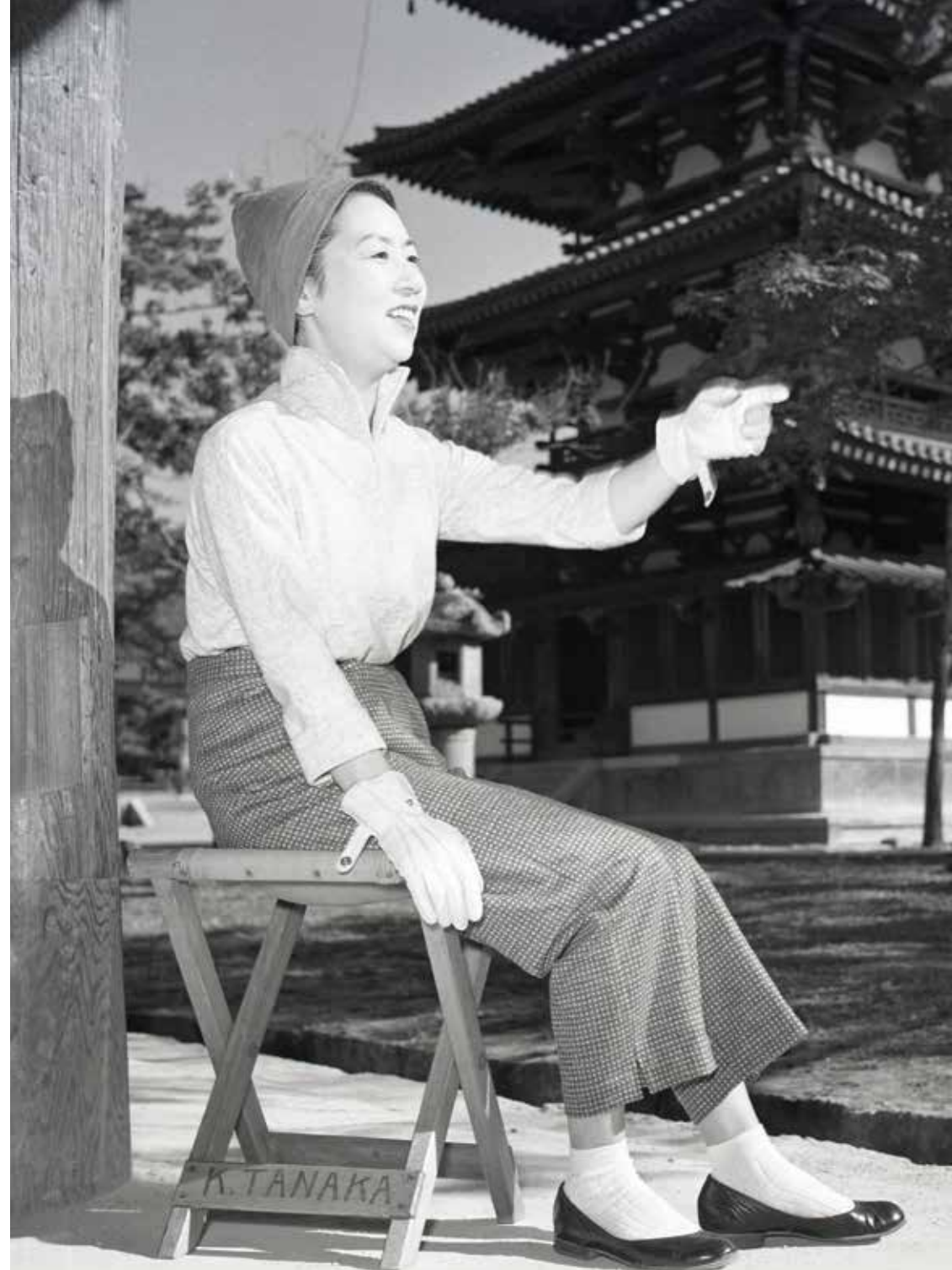
Kinuyo Tanaka sur le tournage de La Lune s'est levée (1955)

FILMS PRÉSENTÉS : L'Horloger de Saint-Paul (1973) – Autour de minuit (1986) – L. 627 (1992) – L'Appât (1995) – Capitaine Conan (1996) – La Princesse de Montpensier (2010) – Quai d'Orsay (2013)