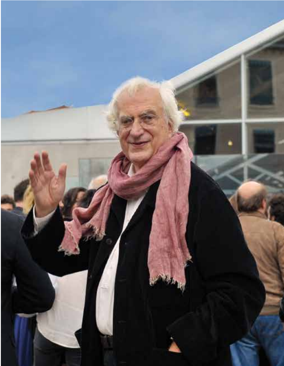
© Institut Lumière / Photo : Sandrine Thésillat - Jean-Luc Mége

À la mémoire de Bertrand Tavernier, président de l'Institut Lumière. (1941-2021)