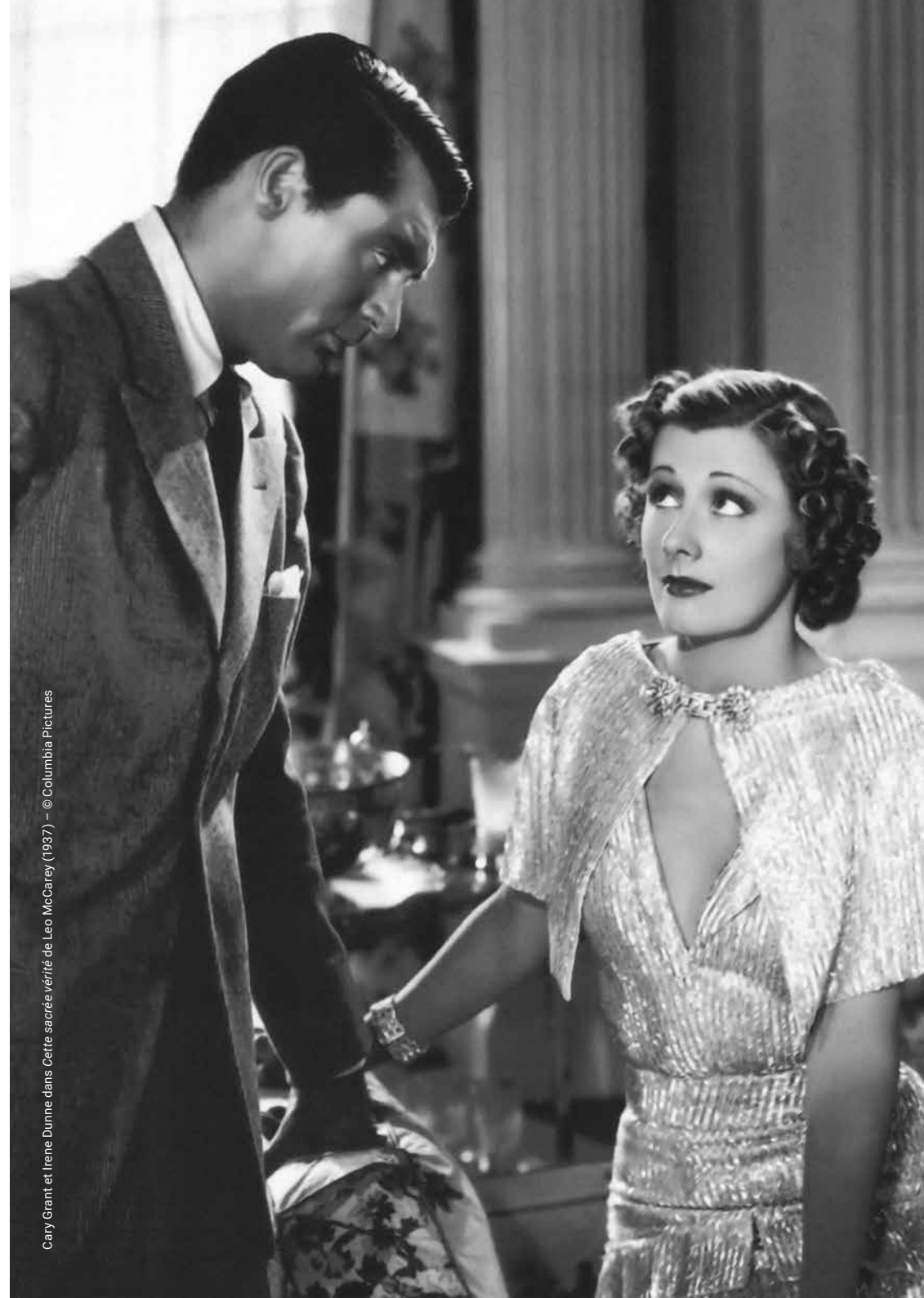
Cary Grant et Irene Dunne dans Cécilia, sacrée vérité de Leo McCarey (1937)